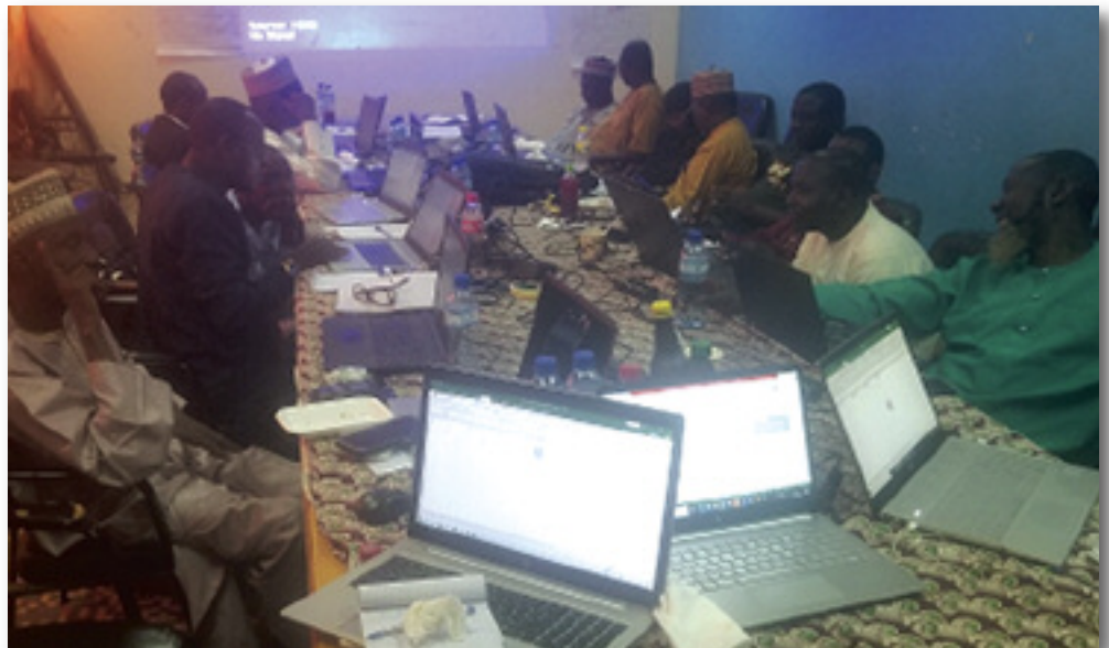
Session de formation des gestionnaires des dispositifs de suivi et évaluation à Kollo

Ainsi, pour répondre aux principaux défis identifiés au sein des collectivités territoriales en matière de suivi et évaluation des actions de développement, Pro-ARIDES a décidé d'accompagner la mise en place de dispositifs pilotes au niveau des trois (3) communes et un (1) au niveau d'un conseil régional. En ce qui concerne les communes, il s'agit de Say pour la région de Tillabéri, Douméga pour la région de Dosso et Bangui pour la région de Tahoua. Pour le conseil régional celui de Dosso a été identifié pour abriter le dispositif pilote.