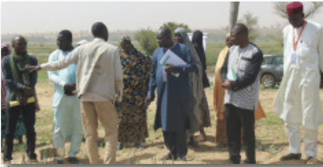
À N°Dounga et Liboré (région de Tillabery) visite du Champ Ecole Maraicher de Molli qui fait la comparaison de 4 méthodes de fertilisation du sol pour la culture de l'oignon ....