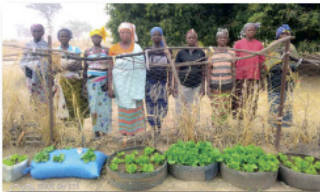
Planches de laitue faites à base de matériels de récupération

Afin d'assurer la bonne alimentation des ménages à travers l'agriculture familiale, CARE et son partenaire de mise en œuvre AFDR, ont initié une formation en maraichage hors-sol au profit des femmes des communes de Imasgo et de Gomponsom. Cette initiative vise à permettre aux ménages de produire facilement à domicile et dans leurs champs de case pour un meilleur accès aux légumes à portée de main.