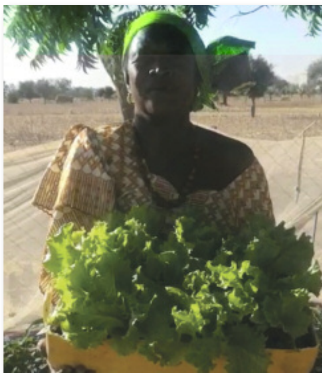
Réplication de la formation dans les jardins de case

De nombreuses femmes ayant participées à ces sessions comme RAMDE Sa-