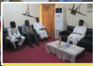
S'enquérir de l'état de mise en œuvre du programme : Le Directeur du programme entame une mission de suivi et de supervision dans les pays P.2