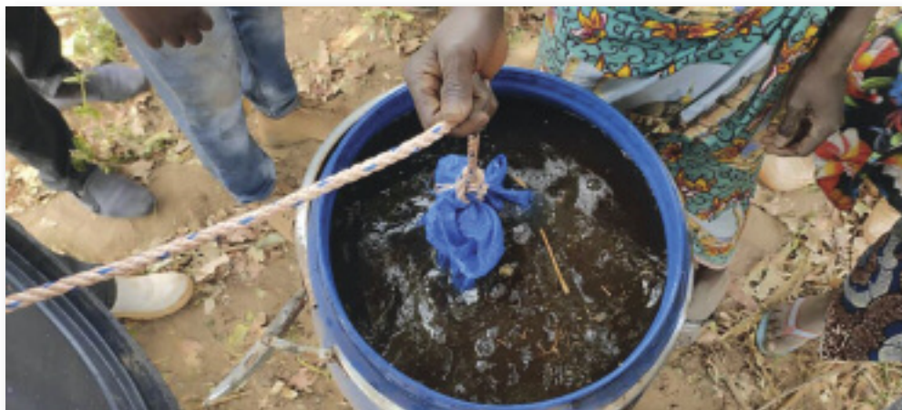
Préparation de « thé de fumier » par les femmes

liorer non seulement la qualité de leurs repas quotidiens mais également de préserver leurs enfants, leurs co-épouses et belles filles enceintes et allaitantes de la malnutrition. ■