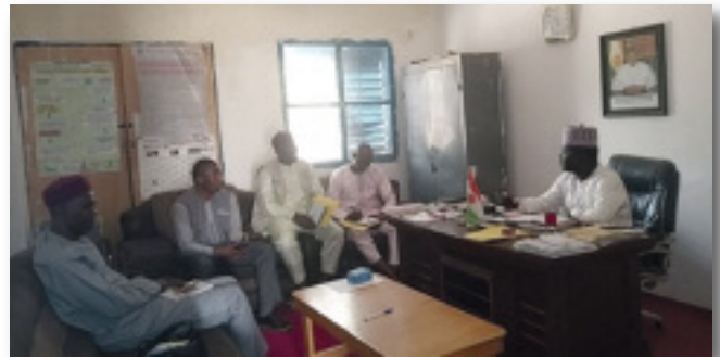
À la mairie de Bangui