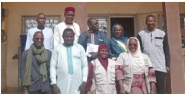
À la mairie de N'dounga

de certaines réalisations du programme dans les communes d'intervention ont permis de s'enquérir directement des résultats de la mise en œuvre du programme sur le terrain. Dans la région de Dosso le directeur du programme a d'abord rencontré le président du conseil régional et son staff pour faire le point de l'appui du programme dans la région. La mission est largement revenue sur le dispositif de suivi et évaluation des communes piloté par le conseil regional de Dosso, dont la mise en place a été appuyée par le programme. La mission du directeur du programme s'est rendue dans la commune de Doumega, village de Angoual Malamaye pour visiter le champs école agropastoral et échanger avec les apprenants. Après la région de Dosso, la mission s'est rendu dans la région de Tahoua ou elle a tout d'abord effectué une visite de courtoisie au gouverneur de la région avant de tenir une séance de travail avec le conseil régional de Tahoua. ■