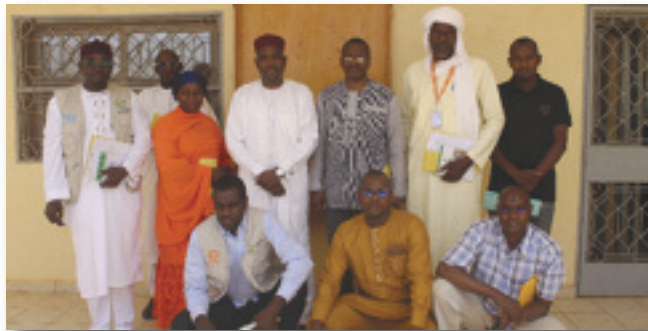
Rencontre d'échanges avec le Conseil Régional de Tahoua

de certaines réalisations du programme dans les communes d'intervention ont permis de s'enquérir directement des résultats de la mise en œuvre du programme sur le terrain. Dans la région de Dosso le directeur du programme a d'abord rencontré le président du conseil régional et son staff pour faire le point de l'appui du programme dans la région. La mission est largement revenue sur le dispositif de suivi et évaluation des communes piloté par le conseil regional de Dosso, dont la mise en place a été appuyée par le programme. La mission du directeur du programme s'est rendue dans la commune de Doumega, village de Angoual Malamaye pour visiter le champs école agropastoral et échanger avec les apprenants. Après la région de Dosso, la mission s'est rendu dans la région de Tahoua ou elle a tout d'abord effectué une visite de courtoisie au gouverneur de la région avant de tenir une séance de travail avec le conseil régional de Tahoua. ■