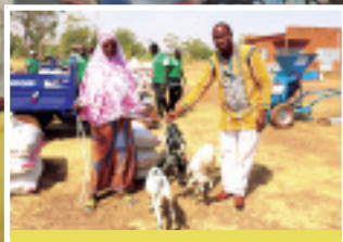
Remise officielle de noyaux reproducteurs et d'équipements agricoles : Le Pro-ARIDES dote les ménages en petits ruminants et les coopératives en équipements agricoles P.4