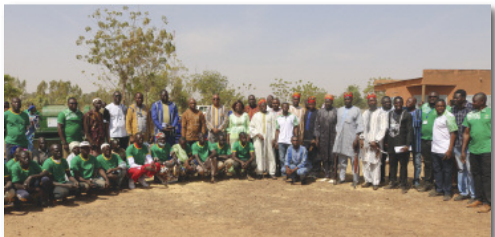
Photo de famille lors de la remise avec le Ministre en charge des ressources animales

Cet accompagnement permettra aux différents ménages de reconstituer leurs moyens de subsistance, et aux coopératives d'accroître non seulement leur production, mais de pouvoir améliorer les services rendus à leur membres. ■