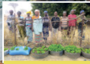
Promouvoir la production familiale : « Des produits frais à nos portes : Le maraichage hors sol pour une bonne alimentation familiale » P.6