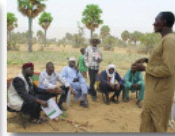
La mission du directeur du programme s'est ensuite rendue dans la commune de Doumega, village de Angoual Mallamaye pour visiter le champs école et échanger avec les apprenants.