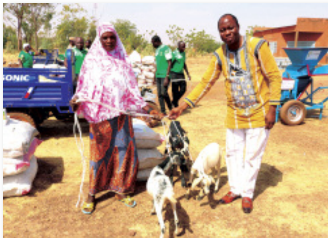
Remise de noyaux reproducteurs par le Coordonnateur national du Pro-ARIDES