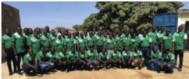
Equipe Pro-ARIDES Burkina Faso